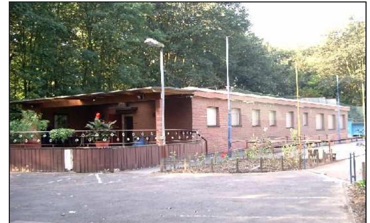
Klubhaus mit Terrasse