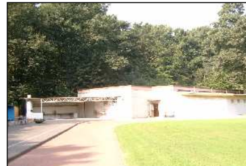
Mehrzweckhalle mit Rasenplatz